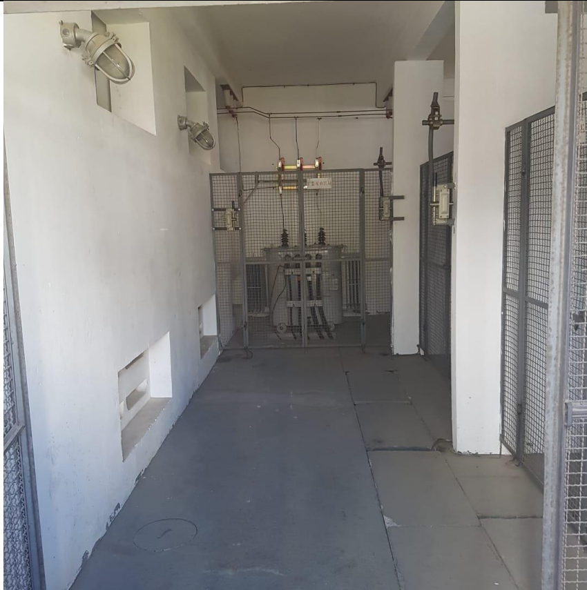
Figura 3 – Área da Subestação Lado 2 com vista para Transformador T3