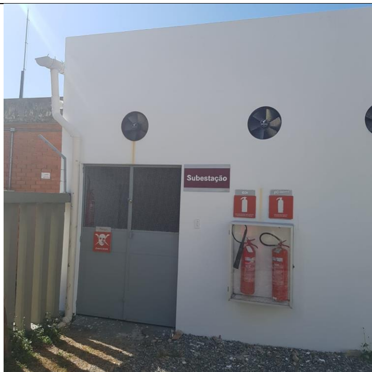
Figura 2 – Entrada Subestação Lado 2