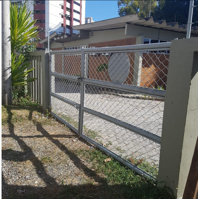
Figura 5 – Portão LACEN