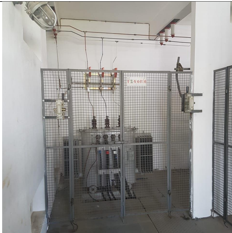
Figura 4 – Transformador T3