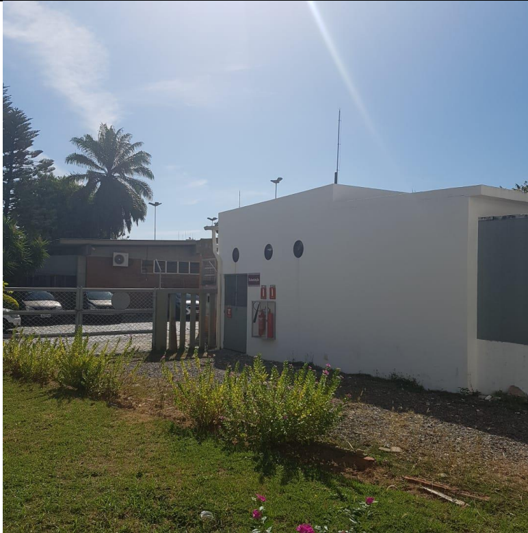
Figura 1 – Entrada Subestação Lado 2 e Portão LACEN